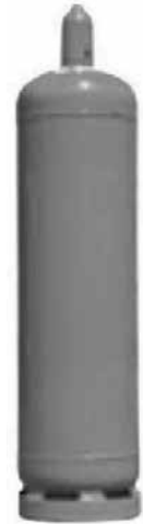
33 kg Pfand