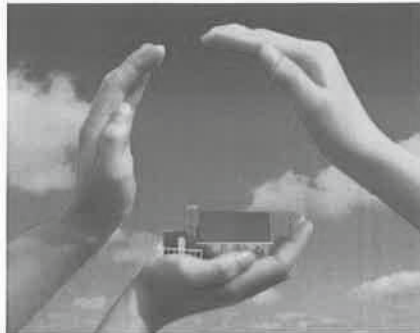
Dienstleistungen rund ums Haus

Neben den klassischen Dienstleistungen wie Hausmeisterservice, Industrie-Glas-, Gebäude- und Unterhaltsreinigung sowie Garten- und Landschaftspflege bieten wir individuell Servicepakete rund um Pflege im Bereich der professionellen Dienstleistungssektors.